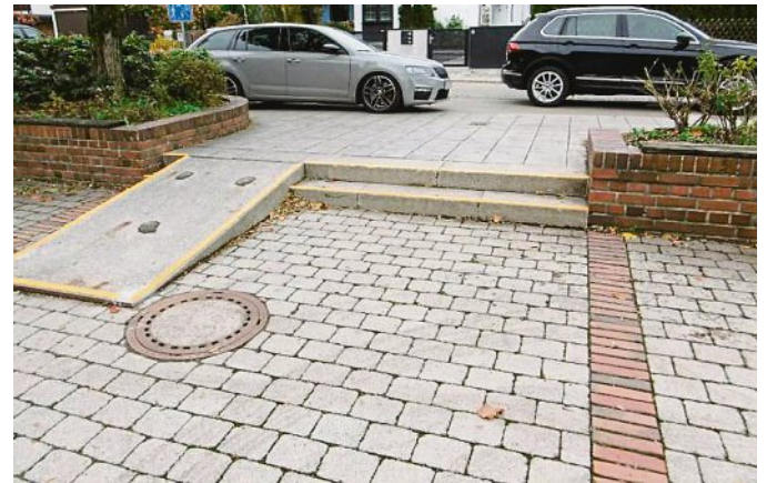
Gutes Beispiel für die Umsetzung: Die Markierung an der Mittelschule Gernerplatz.

Einige der bei der Begehung identifizierten Barrieren konnten seit Ende September bereits bearbeitet werden. So wurden an den Treppenstufen vor der Mittelschule Puchheim Sichtstreifen angebracht, ebenso wie an der Rathhaustreppe und am Sportplatz an der Bürgermeister-Ertl-Straße. Als weitere bauliche Maßnahmen wurde die Bordsteinabsenkung bei der Überquerung Lochhauser Straße – Ecke Frühlingstraße verlängert sowie die schwer navigierbaren Kopfsteinpflaster in der Einfahrt auf der Höhe der Lochhauser Straße 47 durch Platten ersetzt. Außerdem wird die Beleuchtung in der Lochhauser Straße auf LED-Beleuchtung umgerüstet, wodurch die Gehwege zukünftig besser ausgeleuchtet werden. Auch auf dem Friedhof Schopflach wird das Kopfsteinpflaster in Teilbereichen ausgetauscht. Die Gelder hierfür wurden bereits in den Haushalt eingestellt. Am Grünen Markt wurden die schadhafte Kopfsteinpflasterflä-