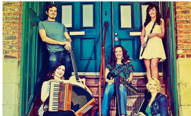
The Outside Track – für Kenner und Freunde keltischer Musik ist der 29. März Pflichttermin.

Veranstalter: Kulturverein Puchheim e.V. und Stadt Puchheim PUC, Béla Bartók-Saal Normalpreis 20,80 Euro; ermäßigt 17,50 Euro; Schüler/Student 9,80 Euro